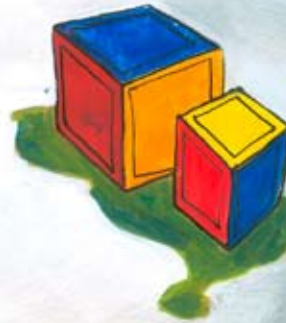
Ilustración: C. Zamalloa.

Cuando crees saberlo todo, un buen día tu hijo o hija llega a casa y enfila sus baterías preguntándote lo mismo que Gaby a su mamá. Y es que, aunque se diga que vivimos en tiempos modernos y de mayor apertura mental e informativa, hablar de sexo con los hijos pequeños resulta todavía difícil para muchos padres.